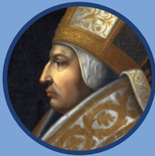
ENEA SILVIO PICCOLOMINI

ha studiato a Ferrara nel '400 prima di diventare Papa Pio II