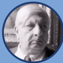
GIORGIO DE CHIRICO

autore della "Gerusalemme Liberata", vissuto alla corte estense